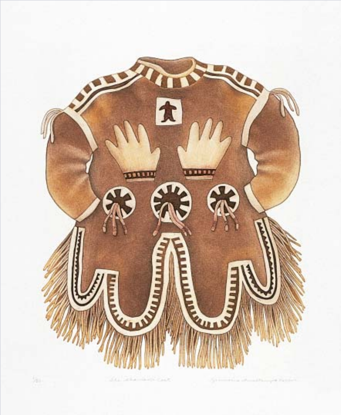
Germaine Arnaktauyok, "Shaman's Coat"