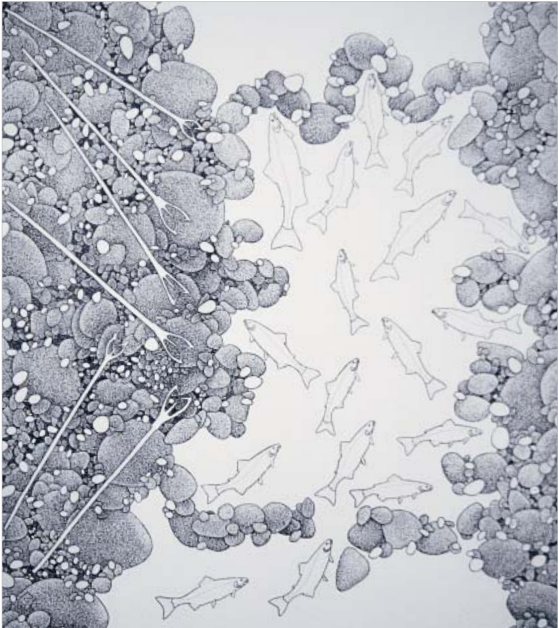
Germaine Arnaktauyok, "The Return"