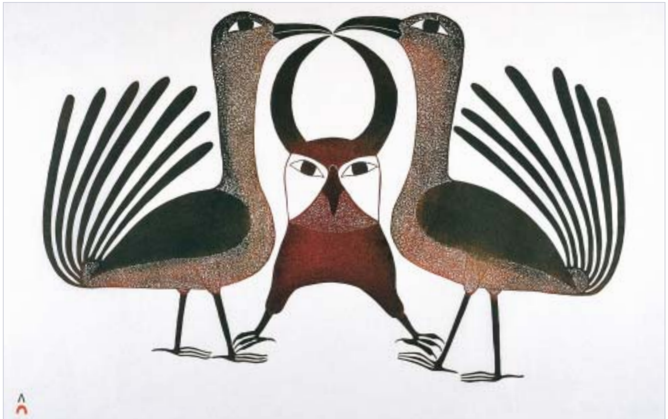
Kenojuak Ashevak, "Birds"