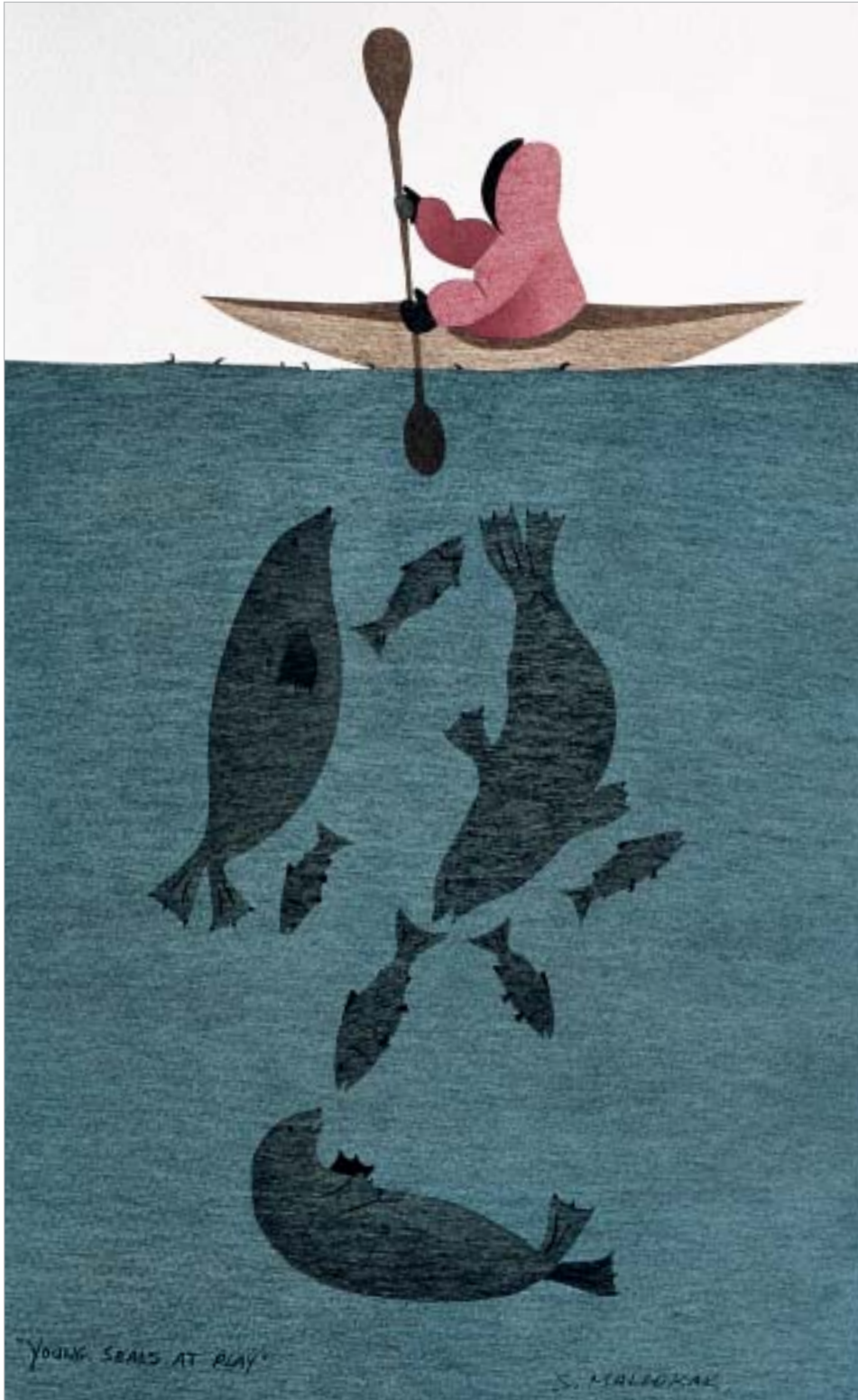
Susie Malgokak, "Young Seals at Play"