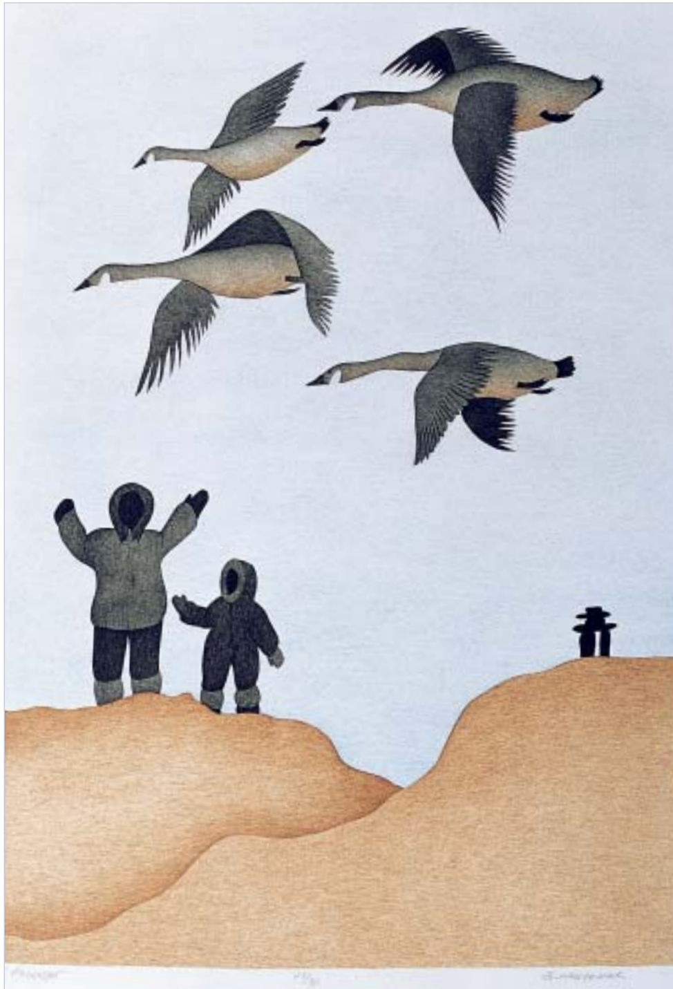
Susie Malgokak, "Good Bye"